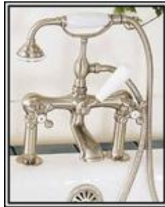
Agujeros en el borde