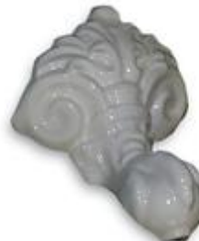
Pata esmaltada en porcelana